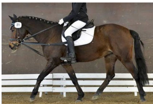
Enrênement fixe à trois points