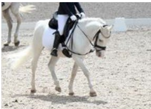
Rênes latérales fixes (Avec/sans anneaux en caoutchouc/ nœuds coulants ou bien intégralement en caoutchouc autorisés)

Le matériau des rênes est secondaire (cuire, caoutchouc, plastique).