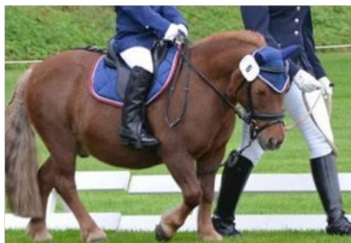
Enrênement fixe avec courroie d'attache à deux points