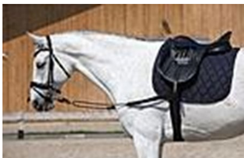
Rênes latérales fixes avec poulie de guidage